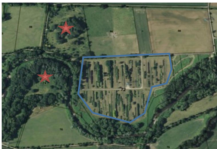
Figure 2 : Détail de la parcelle (les étoiles représentent les puits).